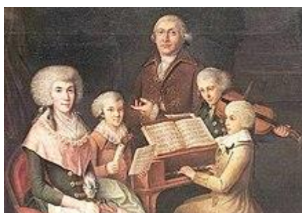
Figura H: Firenze: Mozart al clavicembalo

ASCOLTO/VIDEO: musica di Mozart associata a immagini di Rovereto https://youtu.be/lckukrV5iRs