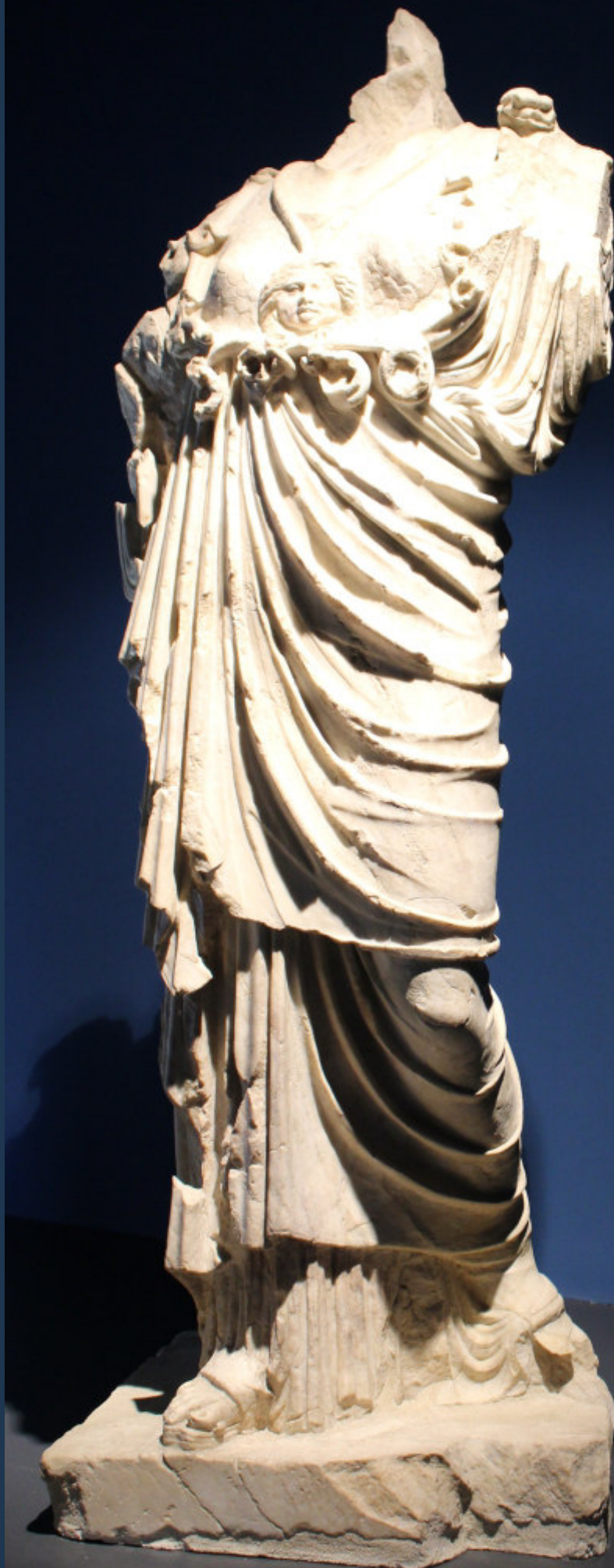
Statua di culto raffigurante Minerva, età augustea o giulio-claudia MUSEO ARCHEOLOGICO NAZIONALE DELLA VALLE CAMONICA - Cividate Camuno (BS)

Aggiornamento per docenti di ogni ordine e grado